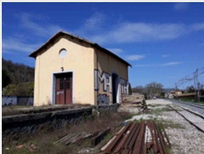
Foto 3 - Magazzino