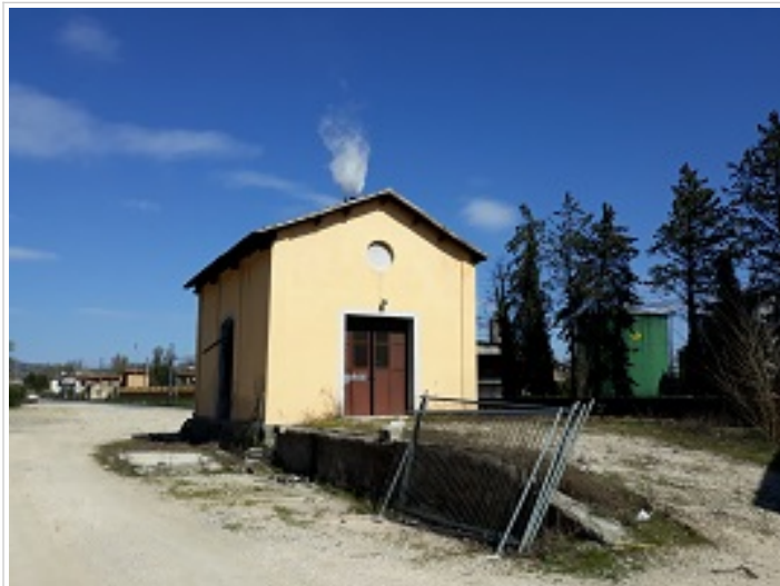
Foto 2 - Magazzino